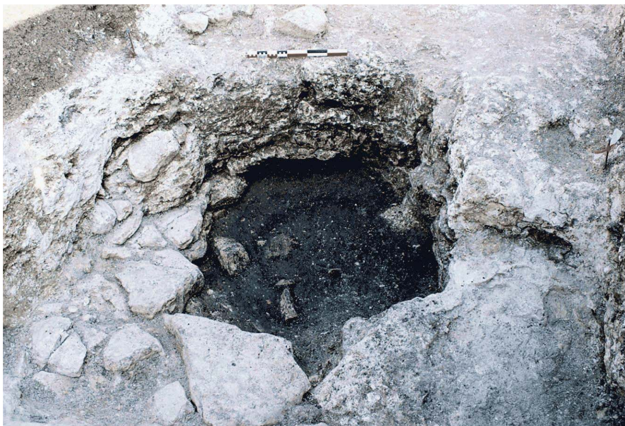
Document 2. Puits creusé dans le calcaire (F. Couvin).