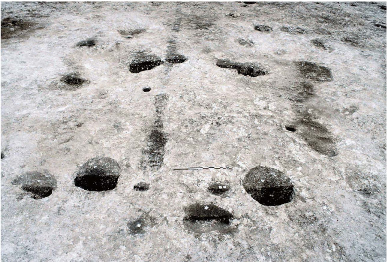
Document 3. Vue d'ensemble des trous de poteau d'un bâtiment (F. Couvin).