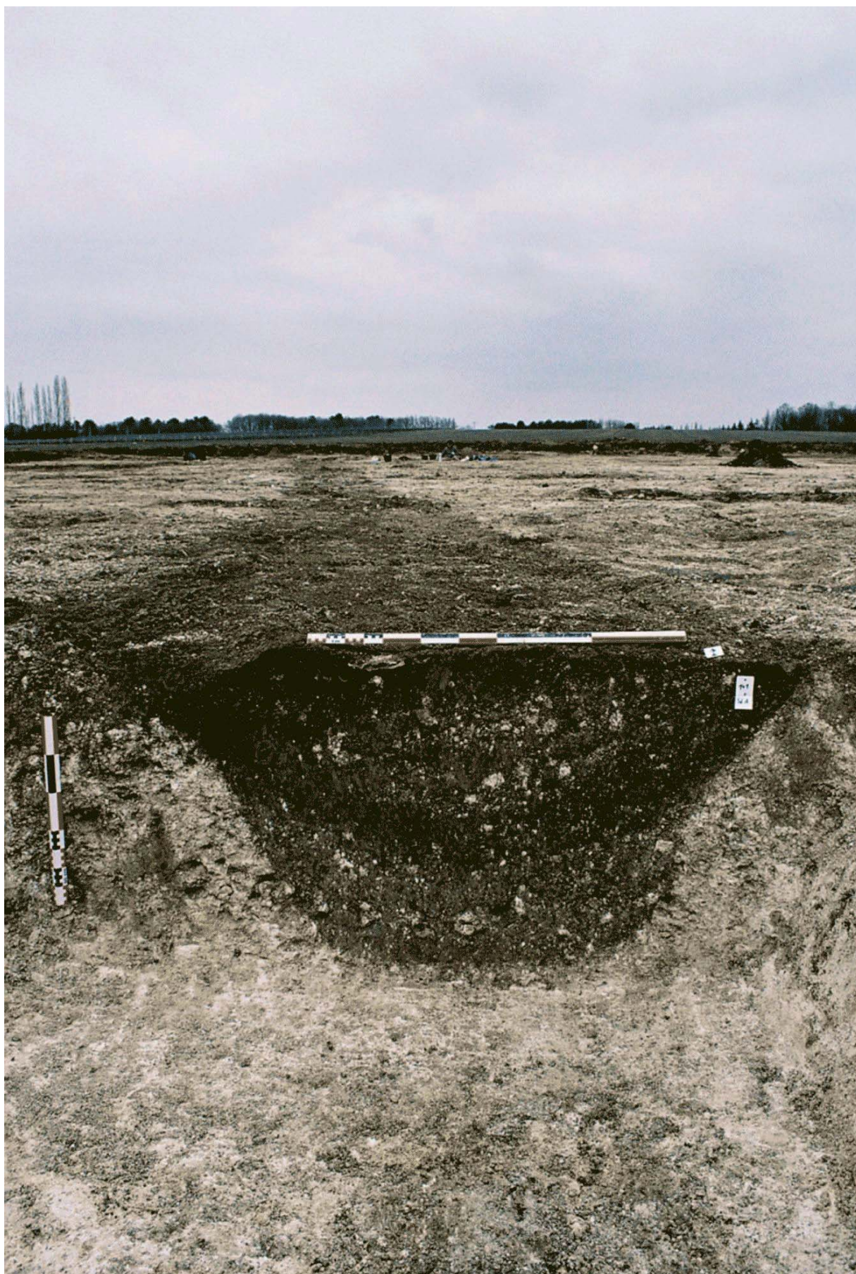
Document 1. Coupe dans le fossé d'enclos (F. Couvin).