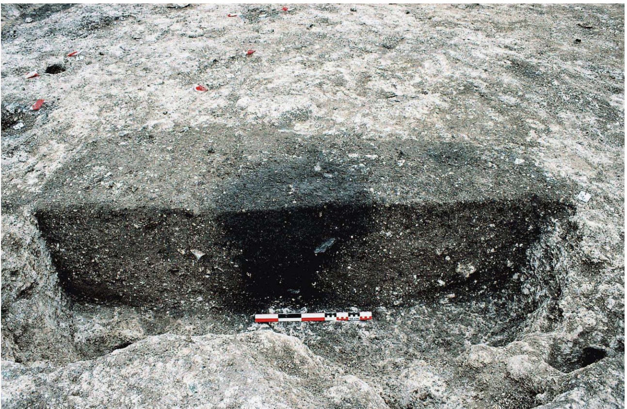
Document 4. Trou de poteau et négatif du poteau visible en coupe (F. Couvin).